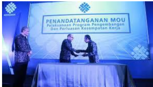
Gambar. 1.5 Kesempatan Kerja

Kesempatan kerja merupakan suatu keadaan yang menggambarkan tersedianya lapangan kerja yang siap diisi oleh para pencari kerja. Kesempatan kerja di Indonesia dijamin dalam Pasal 27 ayat 2 UUD 1945 yang berbunyi “tiap-tiap warga negara berhak atas pekerjaan dan penghidupan yang layak”.