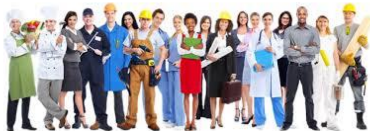
Gambar. 1.3 Jenis-jenis tenaga kerja

Dalam pasal 1 ayat 2 Undang-Undang Nomor 13 Tahun 2003 tenaga kerja yaitu setiap orang yang mampu melakukan pekerjaan guna menghasilkan barang atau jasa baik untuk memenuhi kebutuhan sendiri maupun masyarakat.