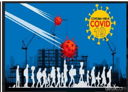
Gambar 1.2 PHK Akibat Covid-19

Salam jumpa pelajar cerdas Indonesia! Pandemi covid-19 telah memberikan dampak yang luas di semua sektor kehidupan. Salah satunya adalah ketika saat Anda diminta untuk mandiri dalam belajar. Senang sekali bertemu Anda walaupun kita tidak bertatap muka secara langsung. Melalui modul ini Anda diharapkan mampu menguasai materi Ketenagakerjaan sebagai bagian dari pembelajaran Ekonomi di kelas XI IPS.