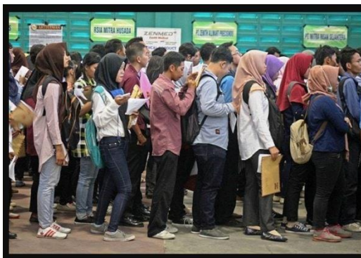
Gambar 1.1 Antrian Pencari Kerja