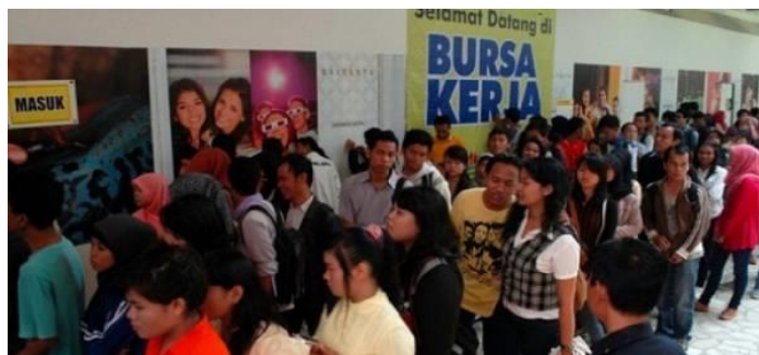
Gambar. 1.4 Angkatan Kerja